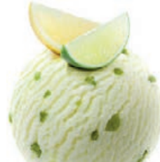
LEMON & LIME

Feine Himbeeren und erfrischende Erdbeeren sind in einem Sorbet vereint. Das tiefe Rot kommt von den Himbeeren, die Erdbeer-Stückchen sorgen für das gewisse Etwas.