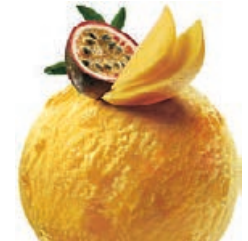
PASSION FRUIT & MANGO

Zitrone und Limette sind zwei Zitrusfrüchte, die zusammengehören. Fruchtig und frisch, zu jeder Jahreszeit.