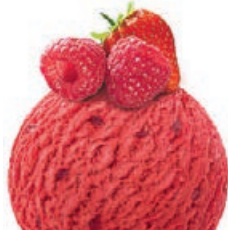
RASPBERRY & STRAWBERRY

Eine Vermählung von luftigem Mascarpone, Biscuit und feiner Kaffeesauce, abgeschmeckt mit Marsala: ein köstlicher und unwiderstehlicher italienischer Dessertklassiker.